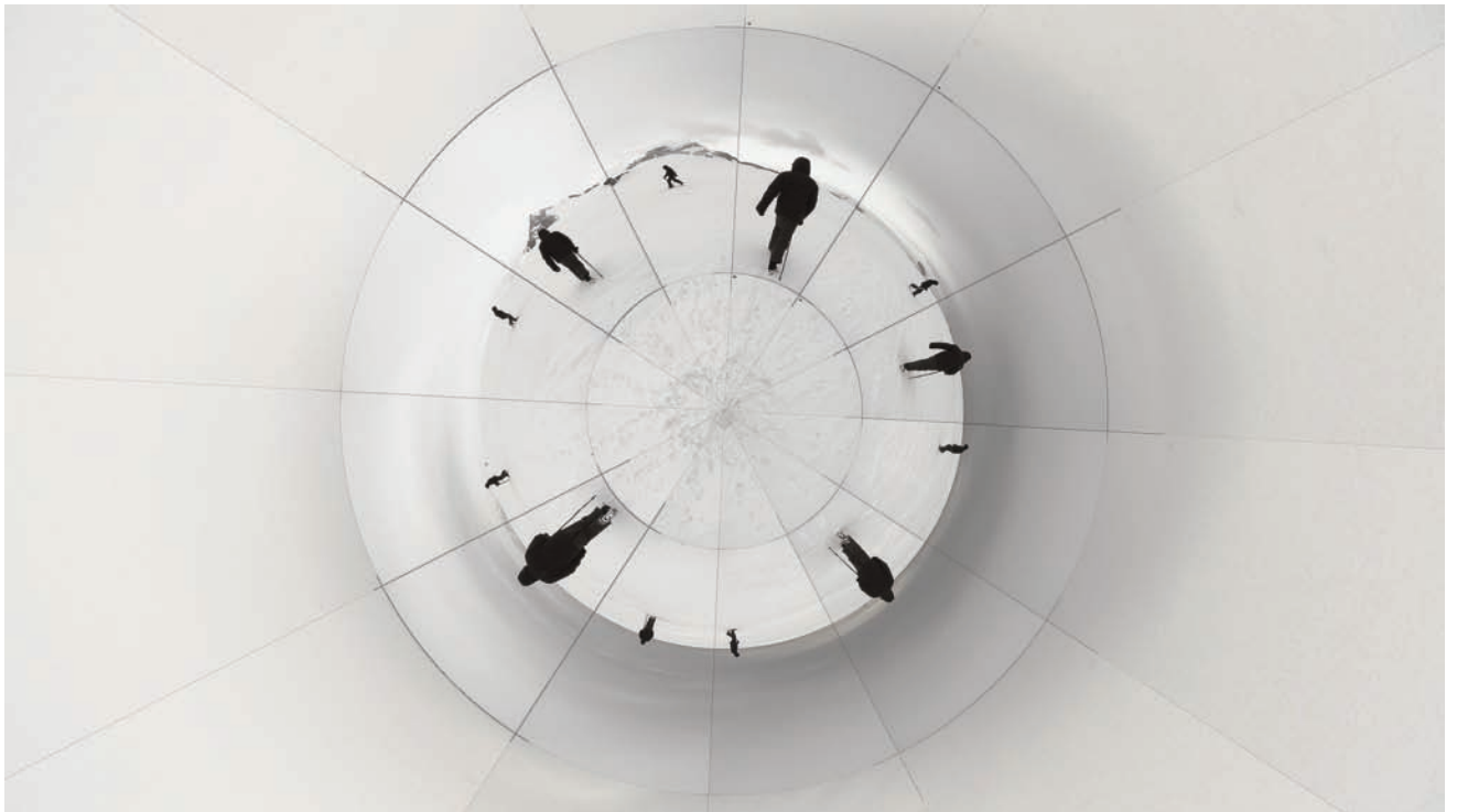
movimiento nº1 Serie develop 2011-2017