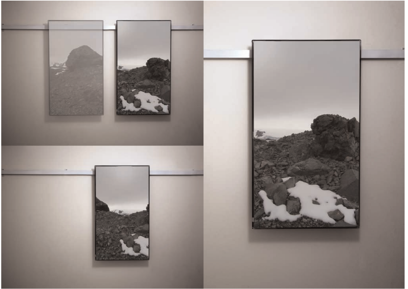
movimiento nº2-i Serie develop 2011-2017