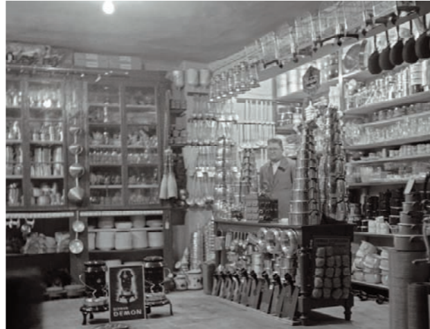
San Miguel de Foces Ibieca. Ant. 1916