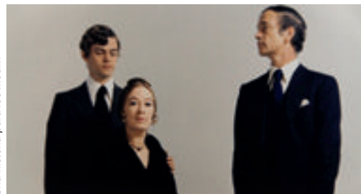
Una historia para los Modlin

IES Pirámide / taller de animación stop motion Álbum de familia