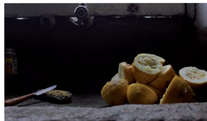
Ser e voltar . Xacio Baño, España, 2014