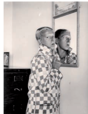
Claude Cahun. Autorretrato , 1928

Taller impartido por Miguel Gallardo Escuela de Arte de Huesca 20 y 21 de enero de 2016